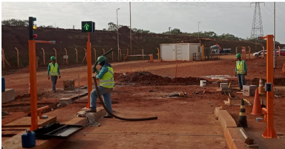
Foto da cabeceira da saída.